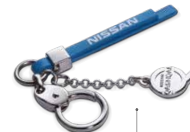
БРЕЛОК С ПОДВЕСКОЙ