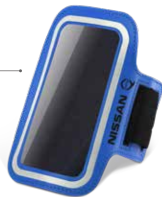
КАРМАН ДЛЯ ТЕЛЕФОНА