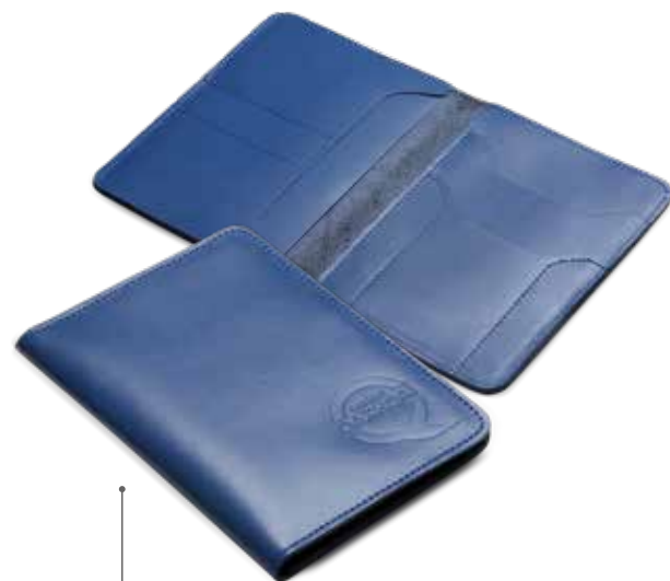
ОБЛОЖКА ДЛЯ ДОКУМЕНТОВ ВОДИТЕЛЯ