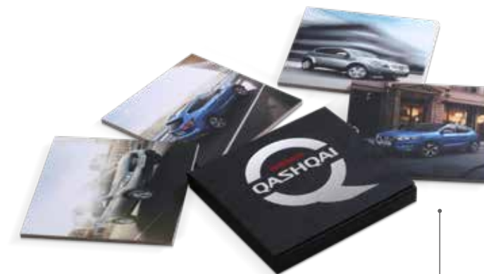
ПОДСТАВКИ ПОД КРУЖКИ